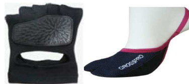
アクアラン・水中W用ソックス