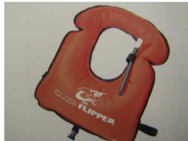
ライフジャケット